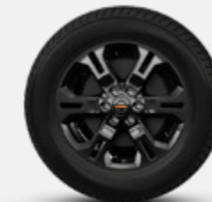
17" DE LIGA (PRO-2X e PRO-4X)

O compromisso de qualidade da Nissan: Para proporcionar a todos os clientes um nível consistentemente elevado de qualidade, a Nissan aplica os mesmo padrões a nível mundial, para assegurar que todos os proprietários da Nissan desfrutem de paz de espírito para a vida dos seus veículos. A abordagem baseia-se na qualidade, na perspectiva do cliente, em três elementos fundamentais: Em primeiro lugar, a expectativa de uma experiência de condução suave com total tranquilidade de espírito. Em segundo lugar, o apelo intangível de um veículo, o seu poder de captivar e excitar, com características que captam a atenção e a imaginação. Terceiro, o nível de atenção e serviço durante o processo de venda, e muito depois da venda estar concluída.