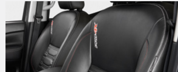
ASSENTOS DE CABEDAL PRETO (Modelo PRO-4X)