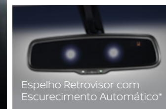
Espelho Retrovisor com Escurecimento Automático*