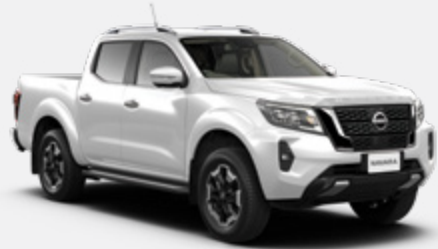
White (S) - QM1