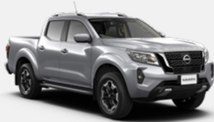
Silver (M) - KYO