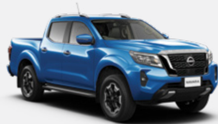
Blue (M) - B16