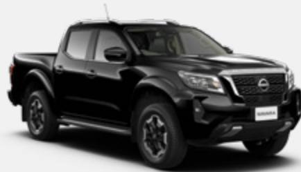
Infinite Black (S) - KH3