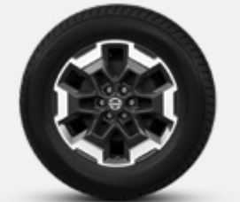
18" DE LIGA (Classe LE)