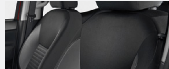
ASSENTOS DE TECIDO (Modelo LE, SE Plus, SE e XE de Cabine Única*) *Opção de vinil cinzento disponível