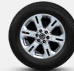
17" DE LIGA