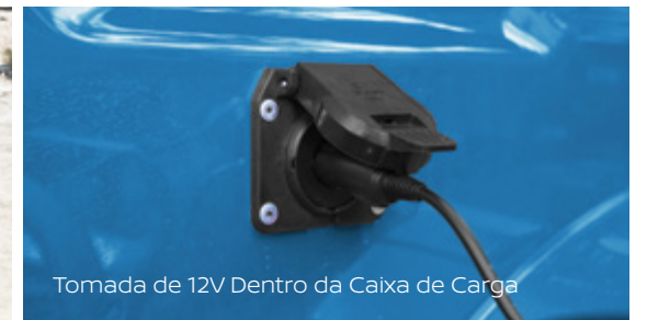
Tomada de 12V Dentro da Caixa de Carga