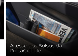
Acesso aos Bolsos da PortaGrande