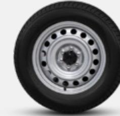
16" AÇO (CABINE ÚNICA)