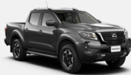
Techno Grey (M) - KY5