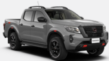
Warrior Grey (PM) - KBY Available on PRO-4X only

Os modelos PRO-2X e PRO-4X estão disponíveis em Branco (S) - QM1, Vermelho (S)- AX6, Preto Infinito (S) - KH3, e Cinzento Guerra (PM) - KBY