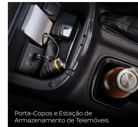
Porta-Copos e Estação de Armazenamento de Telemóveis