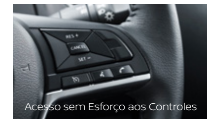
Acesso sem Esforço aos Controles

A Navara maximiza o armazenamento interno e externo. Os bancos traseiros dispõem de armazenamento seguro debaixo do assento e ostentam a capacidade de permanecer convenientemente virados para cima para ajudar a transportar artigos mais altos.