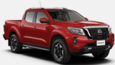
Red (S) - AX6