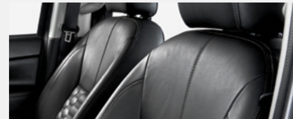
ASSENTOS DE CABEDAL PRETO (Modelo LE Plus)