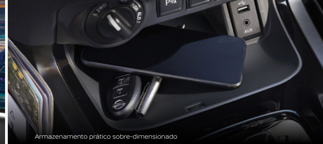
Armazenamento prático sobre-dimensionado

A forma encontra a função ao descobrir como a cabine Navara foi cuidadosamente planeada para se integrar perfeitamente em cada momento; seja para trabalhar, brincar ou lazer. As áreas de armazenamento, a consola de óculos de sol, um porta-luvas sobredimensionado e múltiplos pontos de carregamento fazem da novíssima Navara a companhia perfeita para a vida quotidiana.